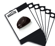
1x User manual

English, Deutsch, Français, Español, Italiano, Nederlands.