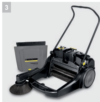
3 Großer Schmutzbehälter