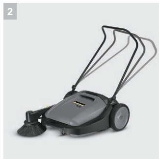
2 Einstellbarer Schubbügel