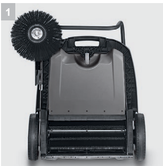
1 Antrieb Hauptkehrwalze