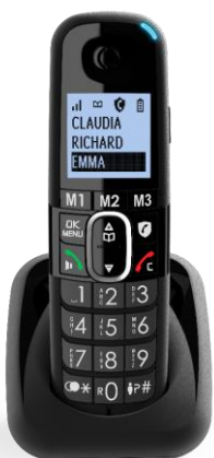
BigTel 1501 Zusätzliches Handteil

Sperrtaste Unterdrückung von unerwünschten Anrufen*