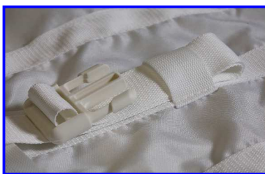
Querbänder in Schlaufen sichern