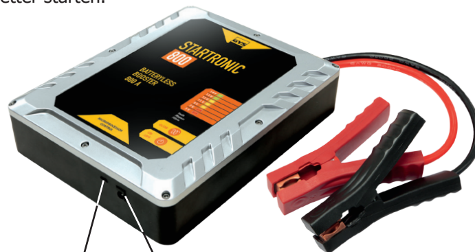
Mikro-USBPort (5V / 2A)