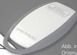
Abb. in Originalgröße